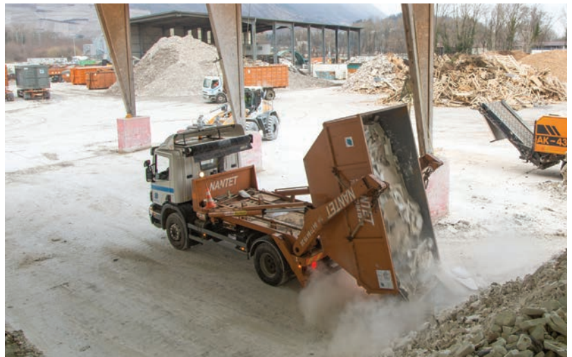
► Déchargement de déchets de plâtre (Placoplatre).

www.lesindustriesduplatre.org Fiche ADEME Économie circulaire