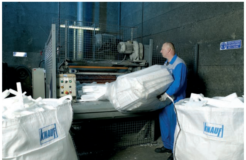
► Recyclage du PSE, polystyrène expansé (Knauf).