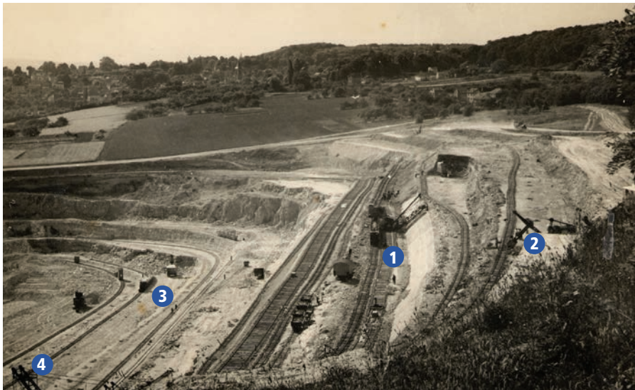
► Vue de la carrière de Cormeilles (fin des années 1950) montrant l'activité de différentes machines. Au centre, un excavateur à godets arrache des marnes vers le haut 1. À droite, on aperçoit le bras d'une pelle à câbles 2. À gauche, au fond de la carrière, une pelle à câbles charge du gypse abattu dans des berlines 3. À l'angle en bas à gauche on devine le bras de l'autre excavateur à godets 4. On peut remarquer sur l'ensemble du site la très forte densité de voies ferrées.

HAUTE DE PRÈS DE 100 MÈTRES ET CONSTITUÉE DE TERRAINS DE DIVERSES NATURES, L'EXPLOITATION À CIEL OUVERT DE LA CARRIÈRE DE CORMEILLES A TOUJOURS NÉCESSITÉ D'IMPORTANTS MOYENS.