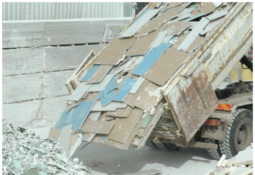
► Collecte de plaques de plâtre (Siniat).