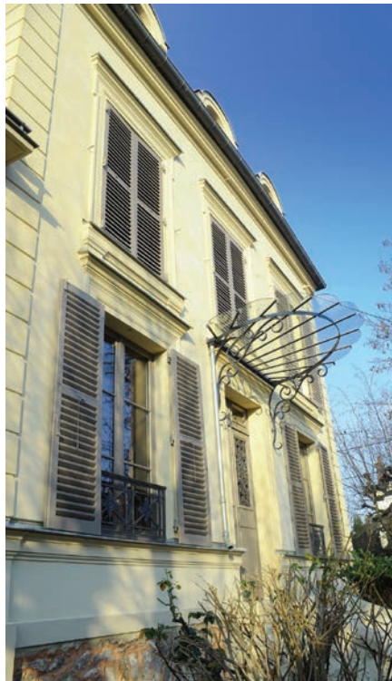
► Le Raincy (Seine-Saint-Denis), ravalement en plâtre coloré, stuc pierre.

Aujourd'hui, les professionnels spécialisés dans le patrimoine bâti parlent davantage de « plâtre d'extérieur » plutôt que de « mortier de plâtre et chaux » pour éviter toute confusion avec les mortiers « à la chaux » dont les caractéristiques physiques et